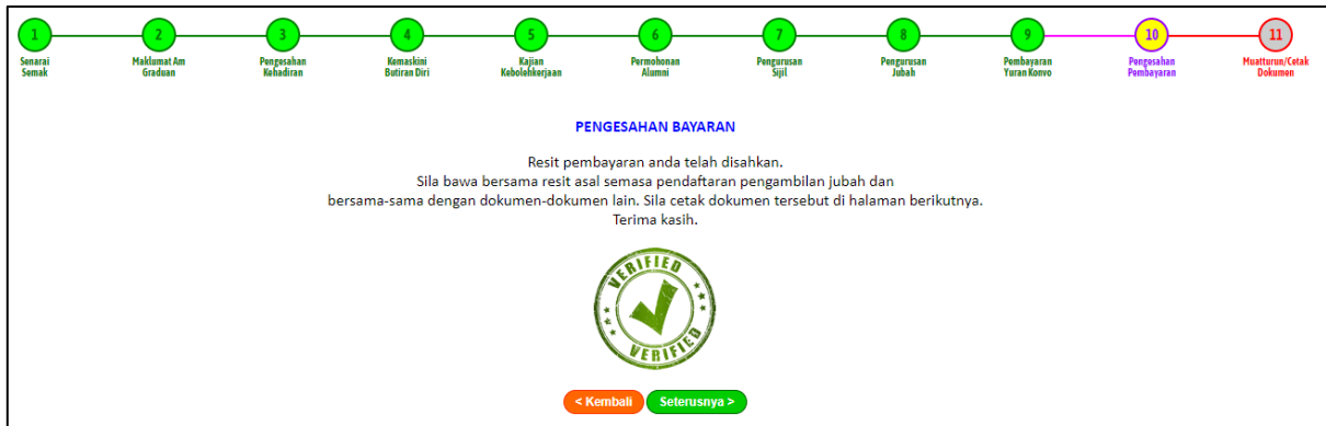
Rajah 5: Paparan Pengesahan Yuran

18. Klik seterusnya ke paparan Pengesahan Pembayaran