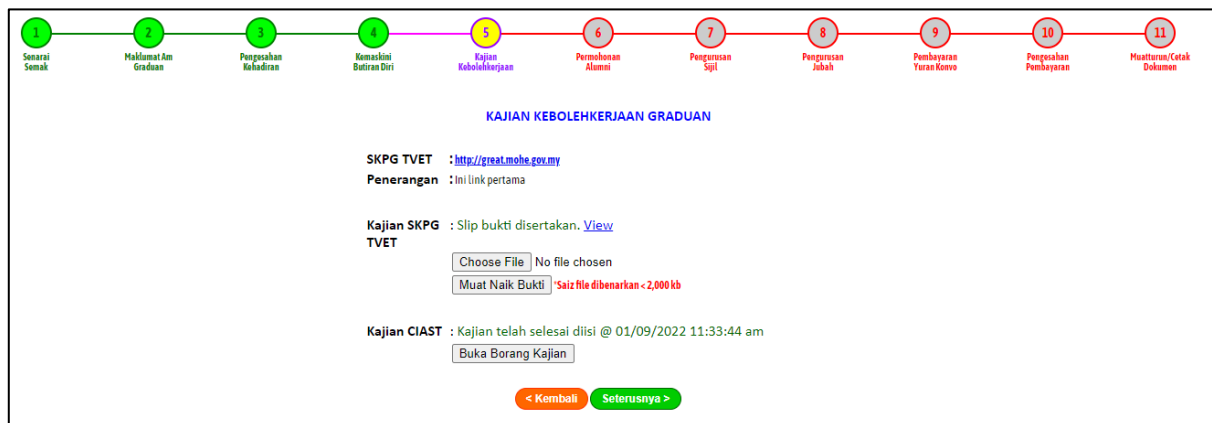
Rajah 2: Paparan kajian keboleherjaan