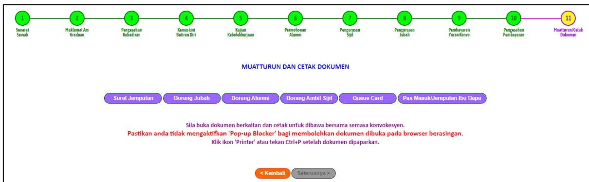
Rajah 6: Paparan Cetak Dokumen

19. Klik Seterusnya ke paparan Cetak Dokumen